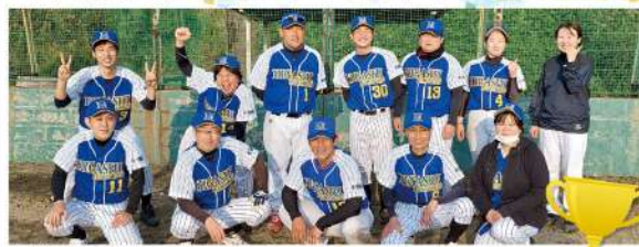
▲東熊本第二病院ソフトボールチーム