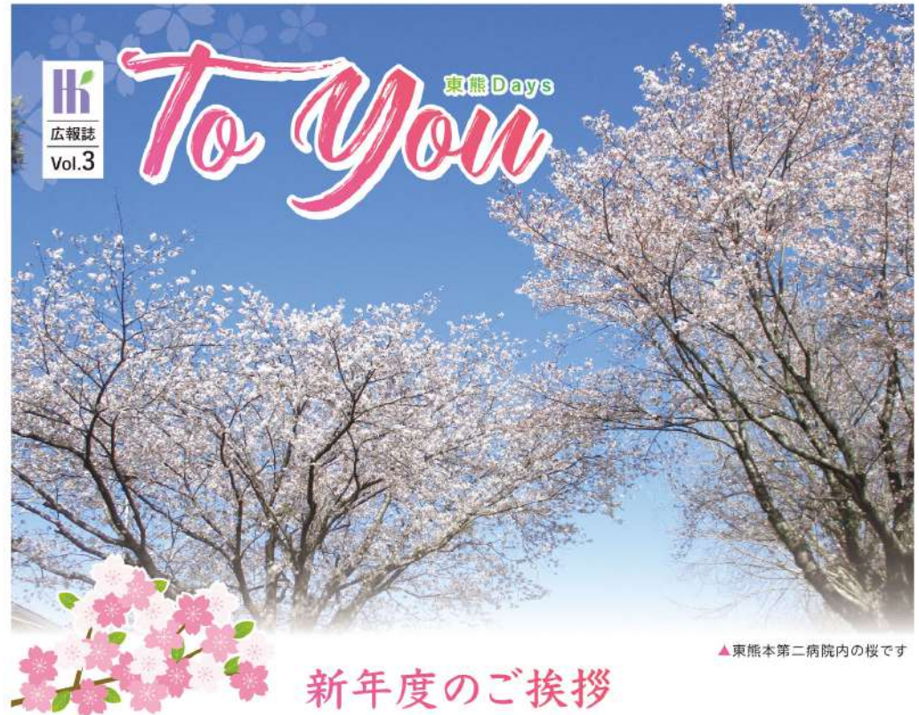
▲東熊本第二病院内の桜です